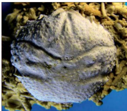
Krabben Dromiopsis rugosa - den mest almindelige krabbe, som mange har fundet på fossiljagter i Faxe Kalkbrud.

I denne lille bog, som forfatterne selv kalder for et "billed-atlas", har vi mulighed for at nyde dele af den omfattende samling af fossiler fra Faxe Kalkbruds lag af koralkalk og bryozokalk. Fossilerne er dels bevarede skaller og skeletdele af calcit og dels aftryk i den hårde kalksten efter nu opløste (især snegle-) skaller. Forfatterne har fremstillet siliconegummi-udfyldninger af disse huller, således at vi nu ser snegle- og muslingeskallerne, som de oprindeligt så ud. Disse afstøbninger er af fotograferingstekniske grunde blevet pudret med det gulligbrune limonit-pulver. I billed-atlasset bringes omkring 200 virkelig gode fotografier, hvoraf